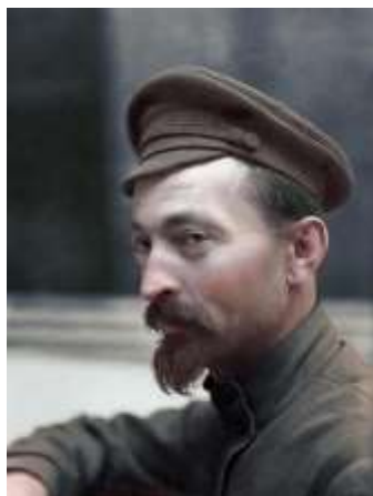
Рис. 7. Глава ВЧК Ф. Э. Дзержинский Его называли «железным Феликсом» и «рыцарем революции» за идейную стойкость, непреклонность и удивительную работоспособность. Он создал одну из самых страшных, но эффективных организаций в России — ВЧК.

7 декабря 1917 г. СНК принял постановление об образовании ВЧК (Всероссийской чрезвычайной комиссии) при Совнарком по борьбе с контрреволюцией и саботажем. Возглавил Ф. Э. Дзержинский (рис. 7).