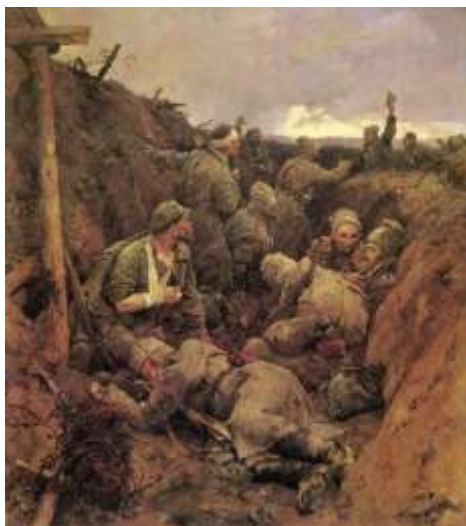
Рис. 1. «Декрет о мире» В. Серов

Второй съезд Советов принял написанные Лениным первые декреты советской власти — о мире и о земле. Декрет о мире предлагал немедленное прекращение боевых действий и заключение мира без аннексий и контрibusiций . Это отвечало стратегическим планам Германии, которая могла избавиться от боевых действий на Востоке (рис. 1)