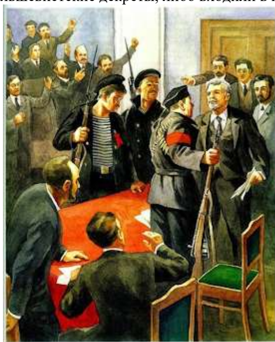
Рис. 4. «Караул устал!»

Такое решение депутатов Учредительного собрания только сыграло на руку большевикам, которые, дождавшись резкого и критического выступления Ленина, покинули зал заседаний. Следом за ними после бурного и малопродуктивного обсуждения иных процедурных вопросов, сопровождавшегося не только скандалами и потасовками, но и угрозами оружием, что пару раз едва не привело к стрельбе, ушли и эсеры. Собрание лишилось кворума, и с этого момента его деятельность была уже бессмысленной. Тем не менее оставшиеся участники заседания решили продолжить работу и успели принять закон о земле, согласно которому она становилась общенародной собственностью, обращение к воюющим державам с призывом не допустить сепаратных мирных переговоров, и провозгласить Россию федеративной республикой. Впрочем, все эти решения уже ни на что не влияли, поскольку либо повторяли первые большевистские декреты, либо входили в противоречие с ними.